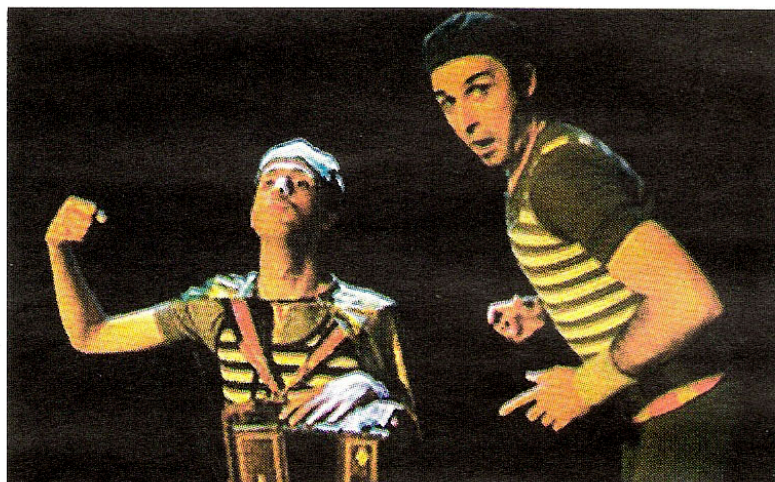
Una imagen del espectáculo.