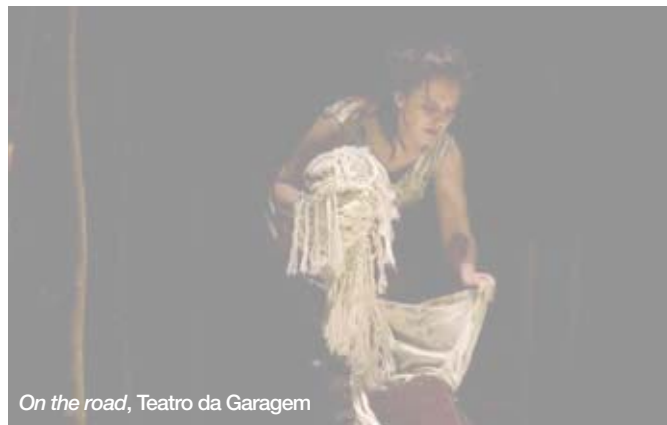
On the road , Teatro da Garagem